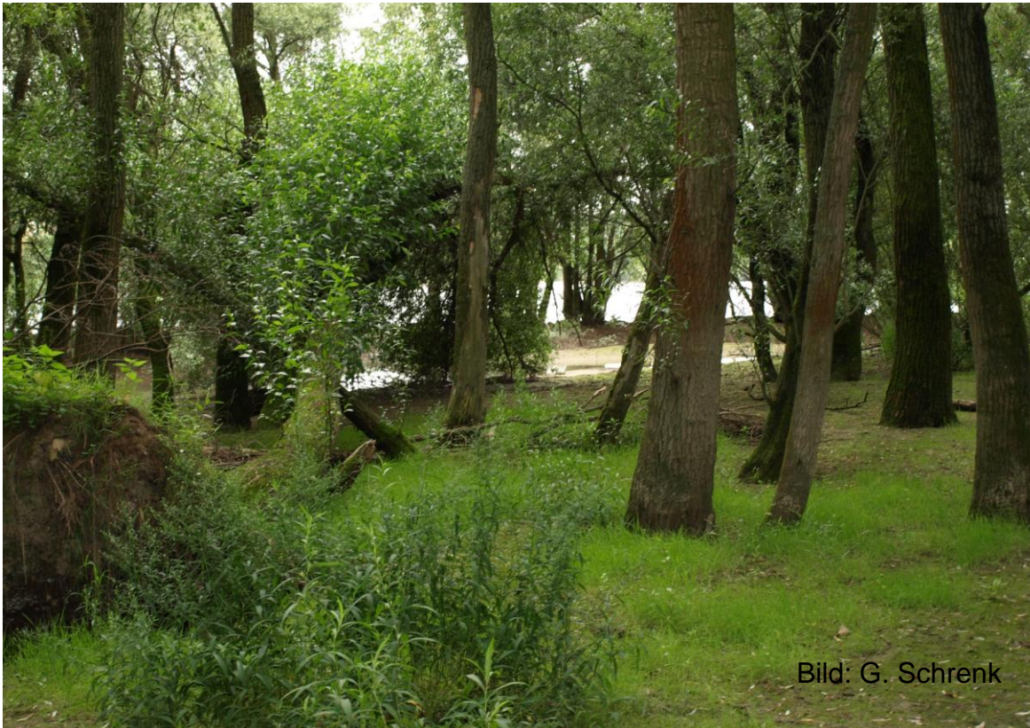
NSG Haderaue- Königsklinger Aue

Liste aller NSG in www.naturschutz.rlp.de