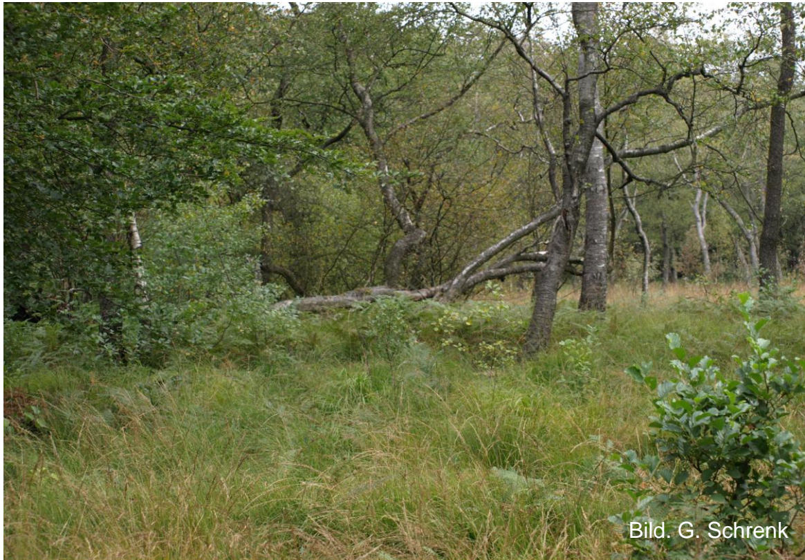
Quellmoor am Rösterkopf

Ergebnisse der Biotopkartierung in www.naturschutz.rlp.de